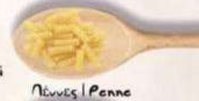
Πέννες | Penne