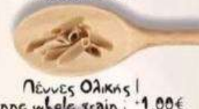
Πέννες Ολικής | Penne whole grain: +1,00€