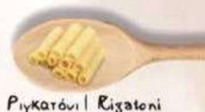
Ριγκατόνι | Rigatoni